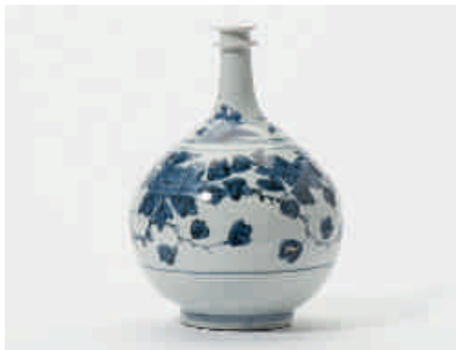
81 Een bolvormige blauw-witte Arita apothekersfles