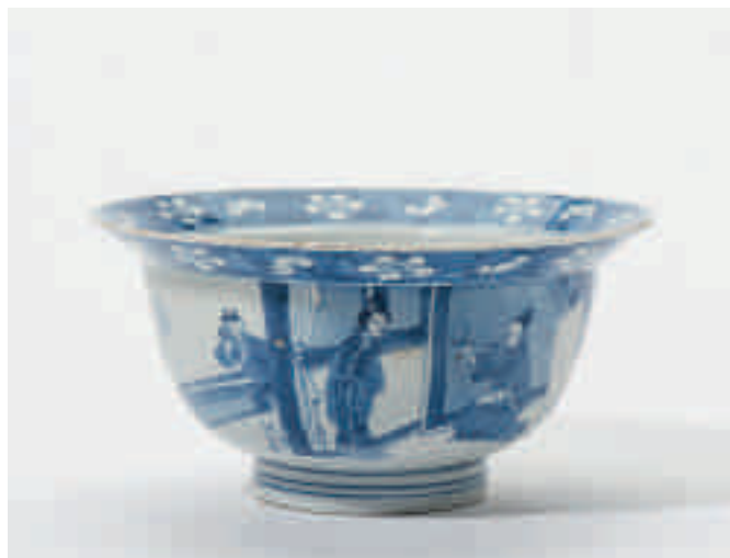
94 Een blauw-witte klapmutskom