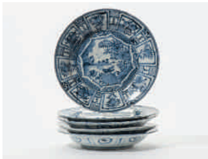
82 Een serie van vijf blauw-witte Arita borden