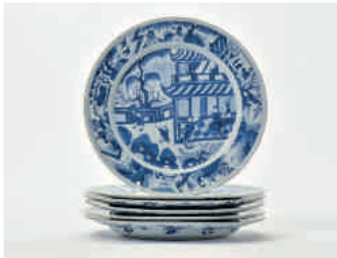
86 Een serie van zes blauw-witte borden