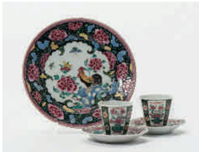
129 Een lakmoes bord en een paar achtkantige dito koppen en schotels Qianlong Het bord met een haan op een rots, insecten en pioenen, de koppen en schotels met pioenen, in de rand bloemenmanden. Diam. 23,2 / H. 6,7 / Diam. 12 cm (5x) € 600 - 1.000