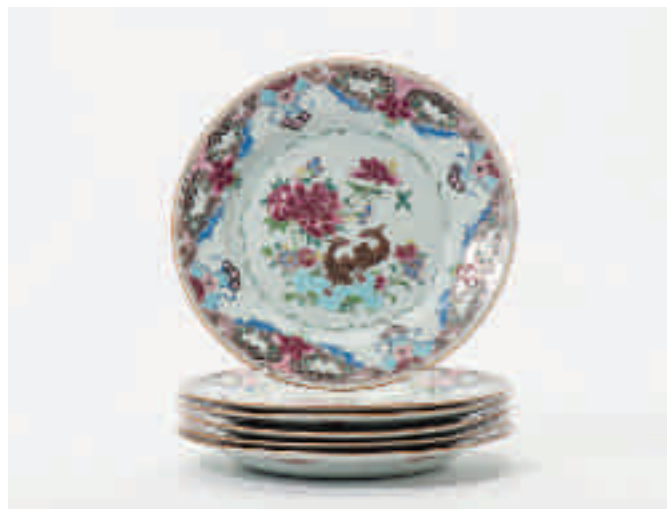
127 Een serie van zes 'famille-rose' borden Qianlong Met een decor van twee ganzen op een blad, waarbij pioenen. Diam. 23 cm (6x) € 600 - 1.000