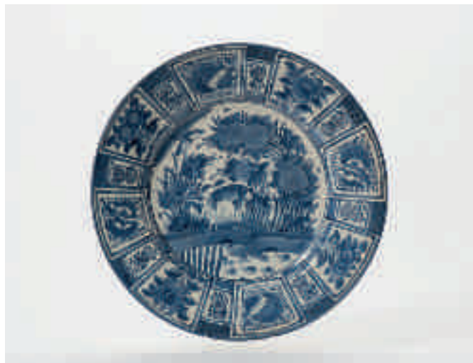
83 Een blauw-witte Arita schotel