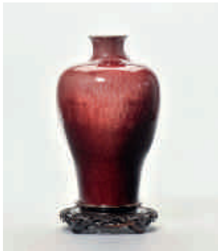
188 Een grote koperrood geglazuurde vaas (meiping)