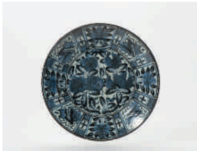
84 Een blauw-witte Arita schotel