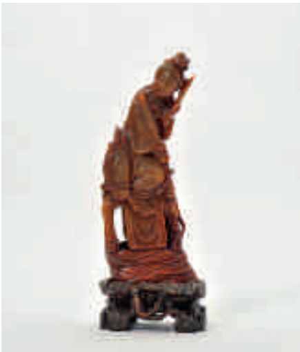
221 Een buffelhoorn figuur