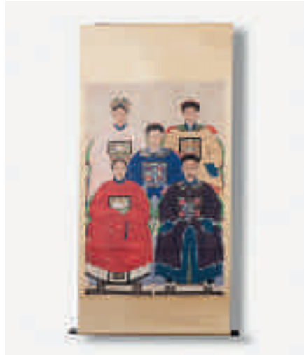
229 Een rolschildering op papier China, 19e eeuw Met de voorstelling van vijf tronende voorouders gekleed in kleurrijke gewaden. Gemonteerd. H. 140 x B. 91,5 cm € 800 - 1.200