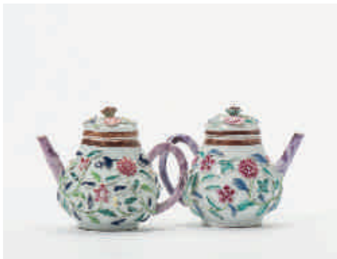
112 Een paar peervormige 'famille-rose' theepotten met deksels Qianlong Met een decor van bloemtakken in reliëf. Met een takvormige paar-se tuit en dito oor. H. 12 cm (2x) € 800 - 1.200