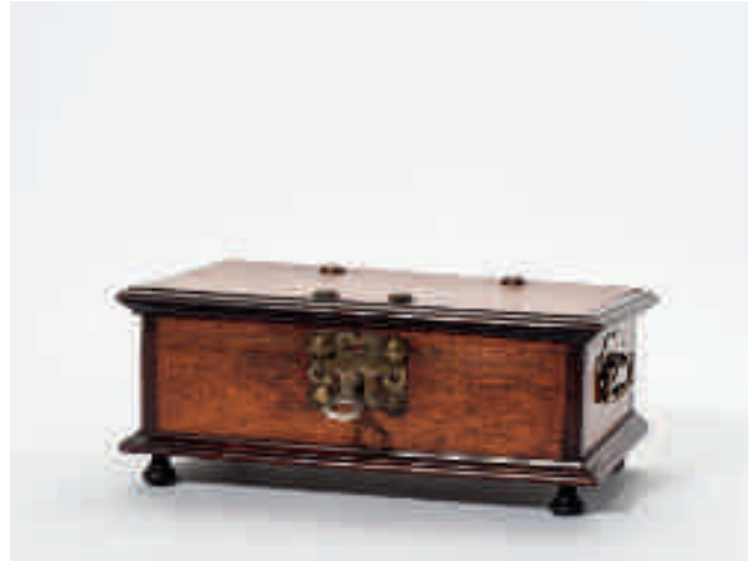
220 Een rechthoekig padoekhouten koloniaal kistje