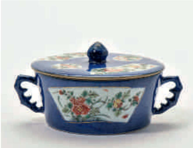
106 Een ronde poederblauwe en 'famille-verte' terrine met deksel Kangxi Met twee grepen en een decor van bloemen in ronde en waaivormige vakken. L. 15,5 cm € 700 - 1.000