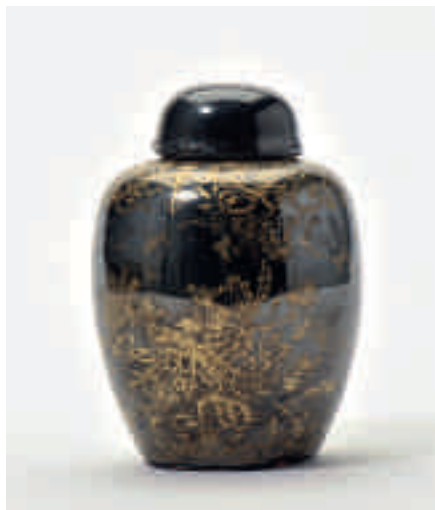
203 Een 'mirror-black' geglazuurde gemberpot met deksel