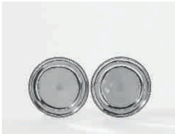
3 Een paar zilveren borden