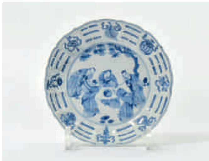
88 Een blauw-wit schaalje met gecontourneerde rand