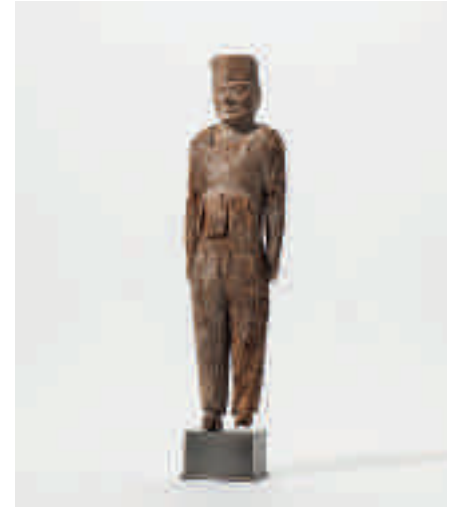
230 Een staande houten figuur Liao dynastie Met buitenlandse gelaatstrekken, hoofddekkel en armen langs het lichaam. Met sokkel. H. 52 cm (excl. sokkel) € 800 - 1.200