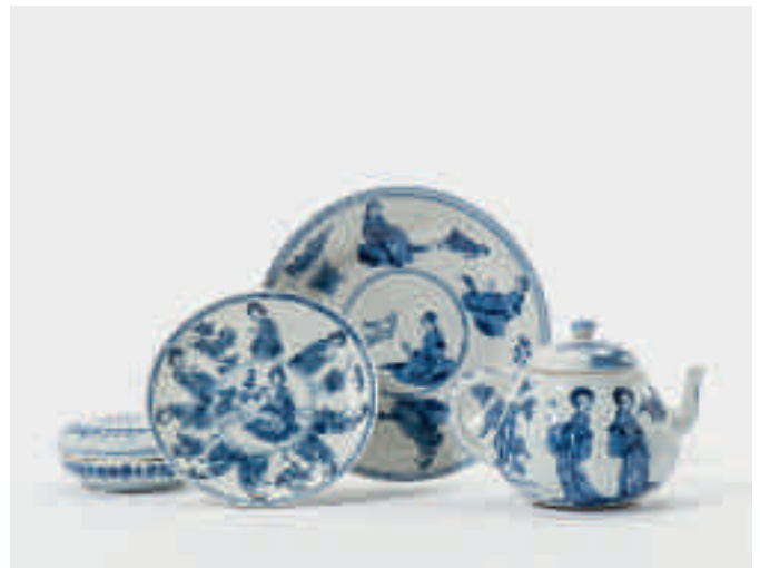
93 Een peervormig blauw-wit theepotje met deksel, een ronde doos met deksel en twee schoteltjes Kangxi Theepotje en schoteltjes met lange lijzen, de doos met prunus binnen een rand van bladeren. Drie gemerkt. H. 8 / Diam. 6,7 / 10 / 12,6 cm (4x) € 700 - 1.000