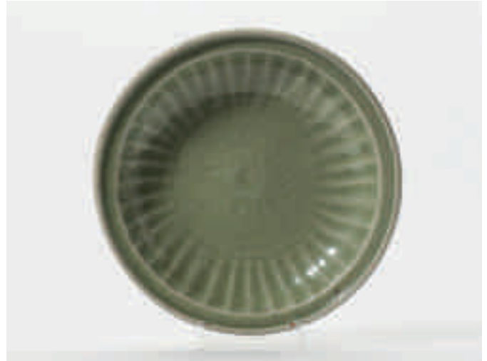
176 Een Longquan celadon schotel