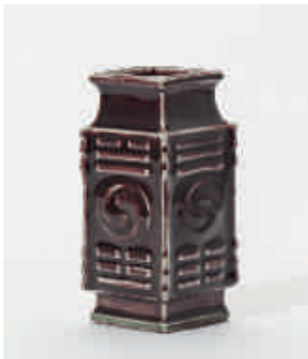
202 Een koperrood geglazuurde ruitvormige vaas