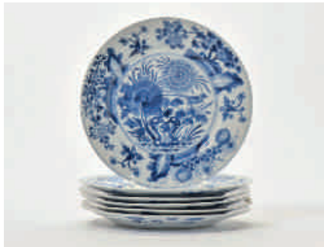
87 Een serie van zes blauw-witte borden