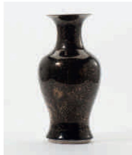
204 Een balustervormige vaas met 'mirror-black' glazuur