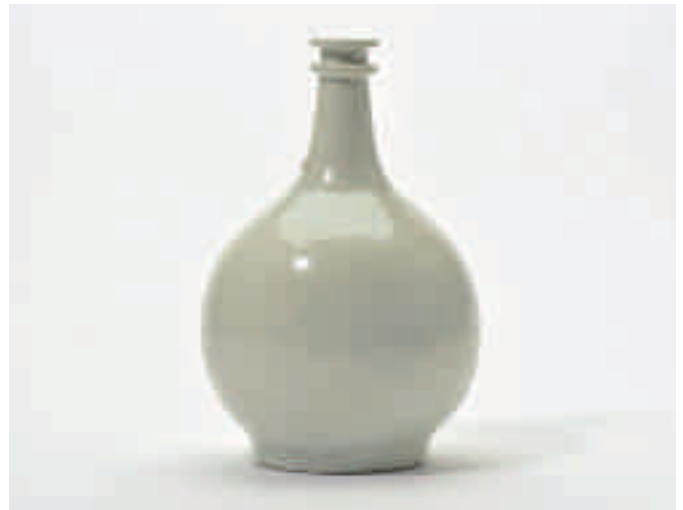
178 Een bolvormige witte Arita apothekersfles