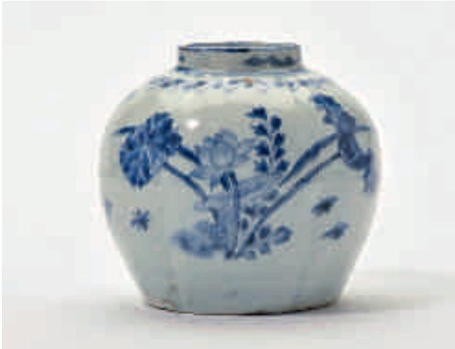
90 Een bolvormige, gebombeerde blauw-witte vaas Transition Met een decor van lotusbloemen, bamboe en insecten. H. 14,2 cm € 600 - 1.000