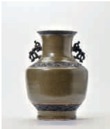
200 Een vaas met 'teadust' glazuur