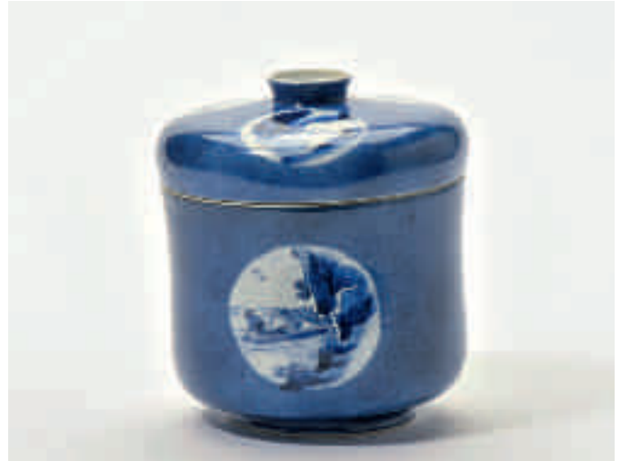
107 Een cilindervormige suikerpot met deksel en poederblauwe ondergrond Kangxi De pot met een decor van drie medaillons, het deksel met soortgelijke decoratie. H. 16,5 cm € 1.000 - 1.500