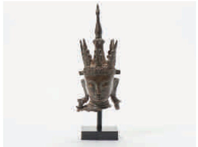
232 Een Shan-stijl bronzen hoofd van de Boeddha Shakyamuni Birma, 18e eeuw Weergegeven met serene uitdrukking, neergeslagen ogen en hoge wenkbrauwen die tot de neus doorlopen, glimlachende mond en lange oorlellen met oorbellen. Het haar is in een knot gekamd waarop een kroon met hoge punten. Op sokkel. H. 25,5 cm (incl. sokkel) Herkomst: - Veiling Christie's Amsterdam, 12 oktober 2004, lot 98 - Particuliere collectie, Nederland € 1.000 - 1.500