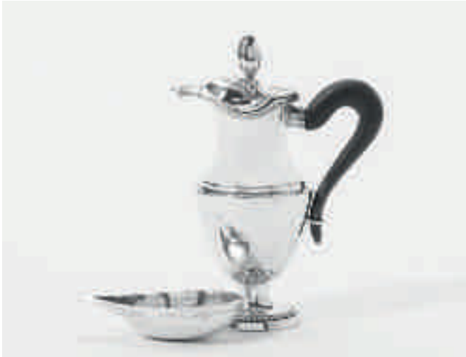
13 Een zilveren melk-/klepkan en een zilveren tastevin Breda, eind 18e eeuw en Den Haag, begin 19e eeuw De kan glad met scharnierend deksel, vruchtvormige dekselknop en schenklip. Vaasvormig lichaam. Op ingesnoerde ronde voet afgezet met een parelrand. Zwart houten gebogen greep. De tastevin peervormig en glad. Langs de buitenrand het gegraveerde opschrift Adams ribbe en wijngarts nat, Maken mij vrolick, dar ick droevich satt . Daarboven een gegraveerde druiventros. Gewicht ca. 300 / ca. 62 gram. H. 20 / L. 11,1 cm (2x) € 600 - 1.000