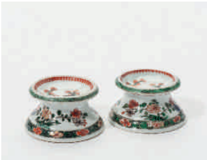
108 Een paar diabolovormige 'famille-verte' zoutvaten Kangxi De bovenzijde met een vogel op een tak, de zijkant met twee bloemtakken. Diam. 8,2 cm (2x) € 1.000 - 1.500