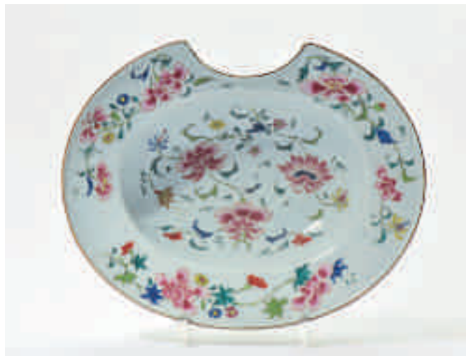
128 Een ovaal 'famille-rose' scheerbekken Qianlong Met een decor van pioenrozen. Aan de achterzijde bloemtakken in ijzerrood. L. 31,3 cm € 600 - 1.000