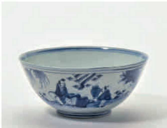
96 Een blauw-witte kom