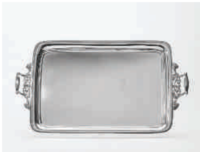
2 Een groot rechthoekig zilveren dienblad met twee grepen