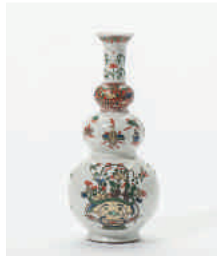
198 Een Samson 'famille-verte' knobbelvaas