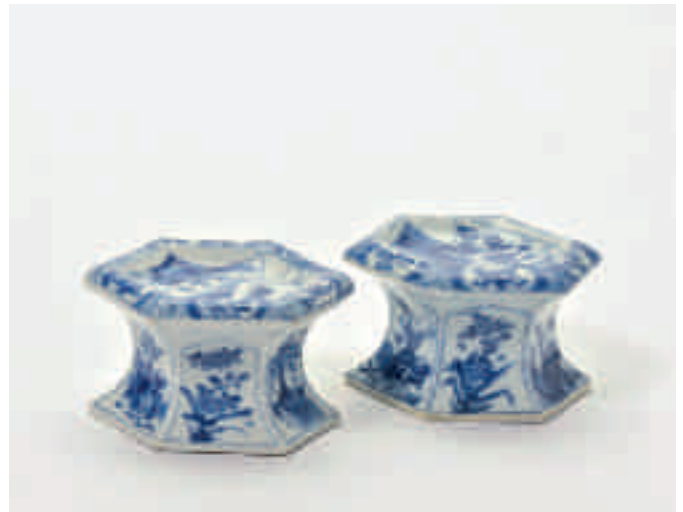
109 Een paar zeskantige, diabolovormige blauw-witte zoutvaten Kangxi Met een decor van twee waaivormige vakken op de bovenzijde. De zijden met florale motieven en kostbaarheden. Diam. 9,5 cm (2x) € 600 - 1.000