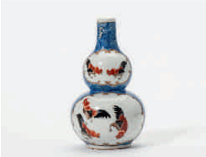
114 Een kalebasvormige vaas met lichtblauwe ondergrond