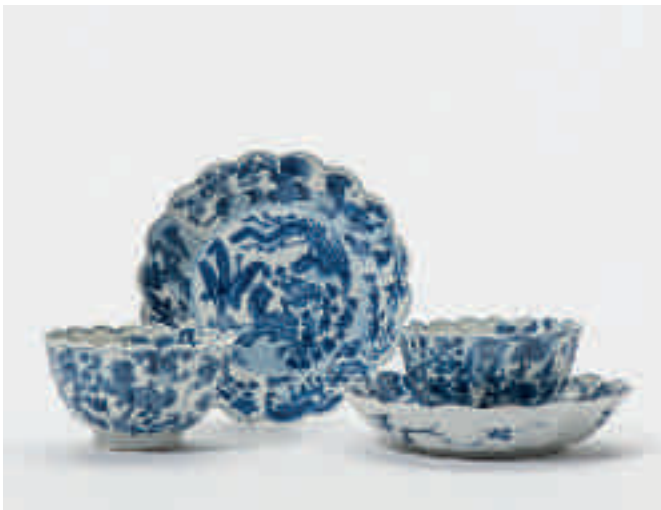
92 Een paar geribde blauw-witte koppen en schotels Kangxi Met een decor van een feniks en een qilin . Gemerkt yu . H. 5 / Diam 13,5 cm Herkomst: - Vandervan Antiquairs, 's-Hertogenbosch (1983) - Particuliere collectie, Nederland (4x) € 600 - 1.000