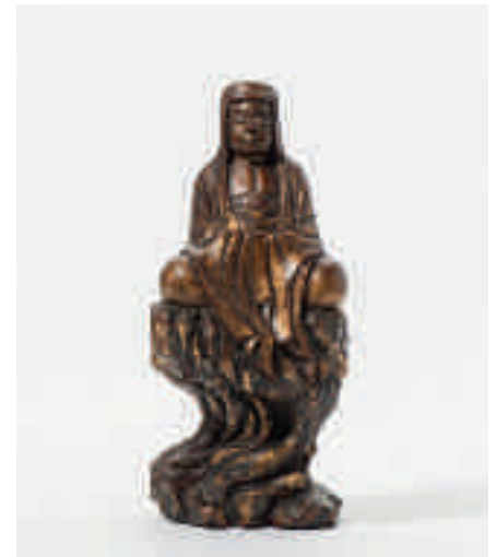
223 Een verguld en gelakt houten tronende Boeddha