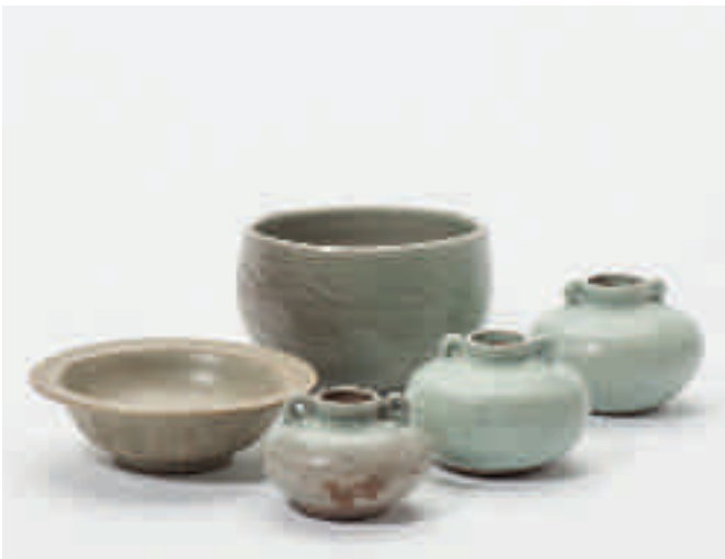
177 Een Longquan celadon kom, een bordje en drie vaasjes