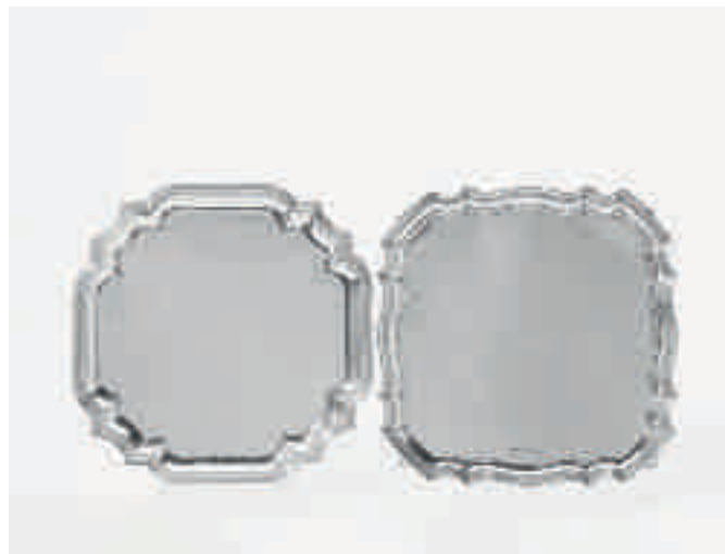
4 Twee verschillende zilveren blaadjes

Sheffield, 1942, Walker & Hall en Den Haag, tweede helft 20ste eeuw, D. J. Aubert