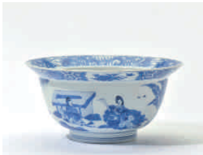
95 Een blauw-witte klapmutskom