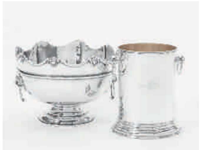
16 Een zilveren flessenkoeler en een zilveren koelvat Chester, 1924, Barker Brothers en Londen, 1925, J.R & Co Ltd. Beide rond en glad. De koeler op spreidende en geprofileerde voet. Aan weerszijden een greep. De 'monteith' met geschulpte bovenrand, gedecoreerd met mascerons. Aan weerszijden een greep gemonteerd in een leeuwenmasker. Op ingesnoerde ronde voet. Sterling, gewicht ca. 537 / ca. 801 gram. H. 16,5 / 15 cm (2x) € 600 - 1.000