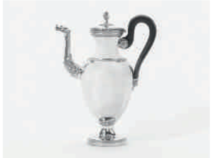
14 Een zilveren koffiekkan Parijs, 1819-1838, onduidelijk meesterteken Glad en amfoorvormig. Gedecoreerd met palmetten en een parelrandje. De dekselknop in de vorm van een vruchtje. De gebogen tuit eindigend in een zwanenkop. Onder de gebogen houten greep een Medusakopje. Op ingesnoerde ronde voet. Eerste gehalte, gewicht ca. 641 gram. H. 27 cm € 600 - 1.000