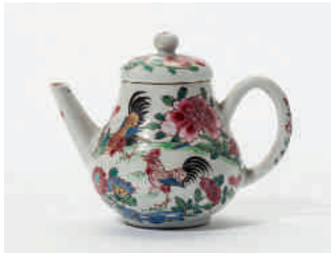
111 Een peervormige 'famille-rose' theepot met deksel Qianlong Met een decor van hanen en pioenen. H. 11 cm € 700 - 1.000