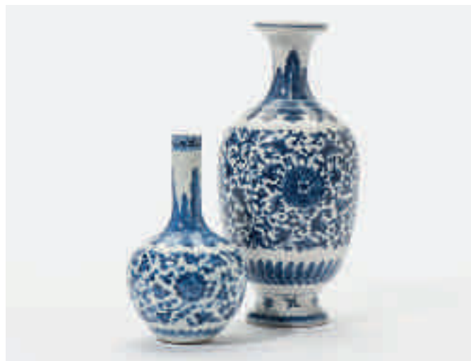
195 Twee 'soft paste' vaasjes