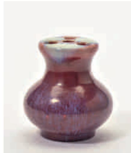
201 Een bolvormige bloemsteker met 'flambé' glazuur