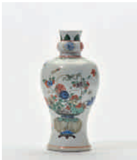
197 Een balustervormige 'famille-verte' vaas