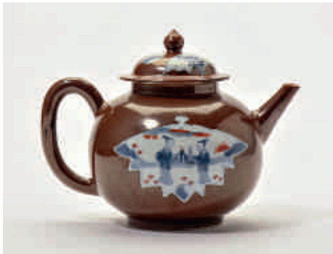
110 Een grote bolvormige kapucijner theepot met deksel Qianlong Met een decor van lange lijzen in twee bladvormige vakken, met rechte tuit en C-vormig oor. H. 20 cm € 1.000 - 1.500