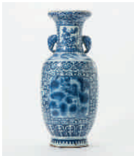
196 Een grote blauw-witte vaas