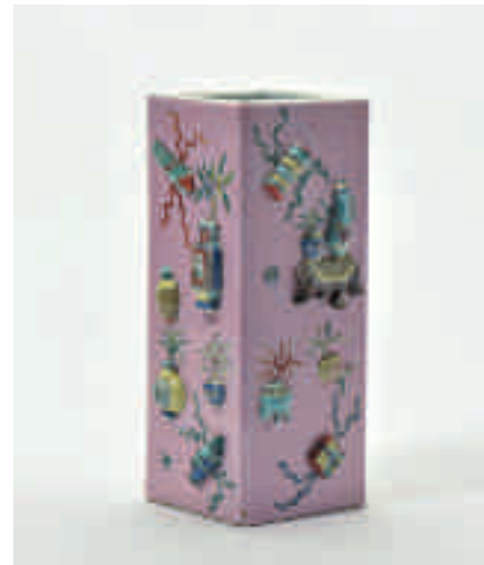
190 Een vierkante vaas met roze ondergrond