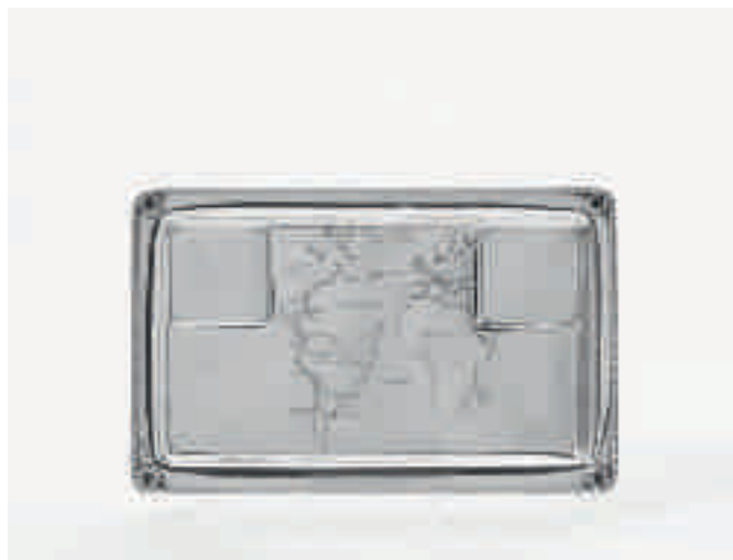
1 Een zilveren (herinnerings)blad, Cartier