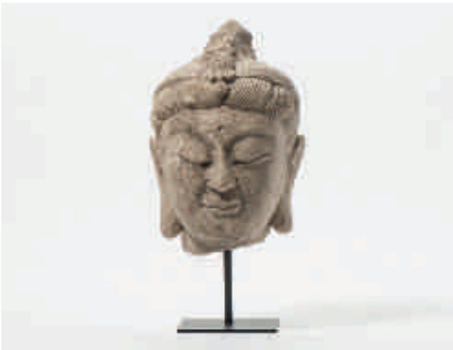
231 Een stenen hoofd van Boddhisatva Ming dynastie Het gezicht met serene uitdrukking, de ogen neergeslagen, lange oorlellen en boogvormige wenkbrauwen. Met sokkel. H. 27 cm (excl. sokkel) € 800 - 1.200