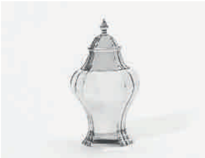
15 Een balustervormige zilveren theebus met deksel Rotterdam, 1761, onbekend meesterteken De hoeken gebombeerd, met platte dekselknop. Tweede gehalte, ca. 200 gram. H. 17 cm € 800 - 1.200