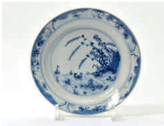
89 Een blauw-wit bord