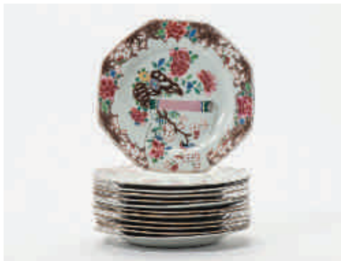
126 Een serie van twaalf achtkantige 'famille-rose' borden Qianlong Met een decor van een schriftrol en pioenen bij een rots binnen een bladvormig perk. Diam. 23 cm (12x) € 1.800 - 2.500