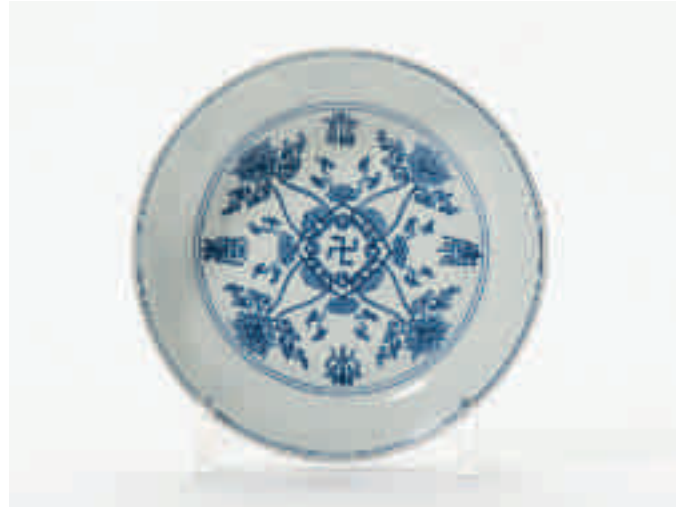
91 Een blauw-wit schaalje Kangxi Met een decor van een centraal zonnerad, waaromheen gestileerde lotusbloemen en Chinese karakters. Aan de achterzijde een soortgelijk decor. Zeskaraktermerk Chenghua . Diam. 16 cm Herkomst: - Veiling Christie's Amsterdam, 26 september 1985 - Particuliere collectie, Nederland € 700 - 1.000