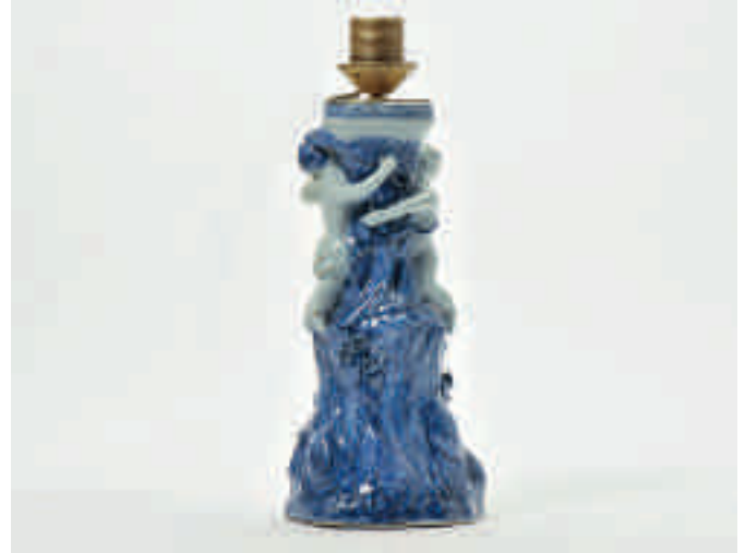
115 Een blauw-wit voetstuk van een tazza