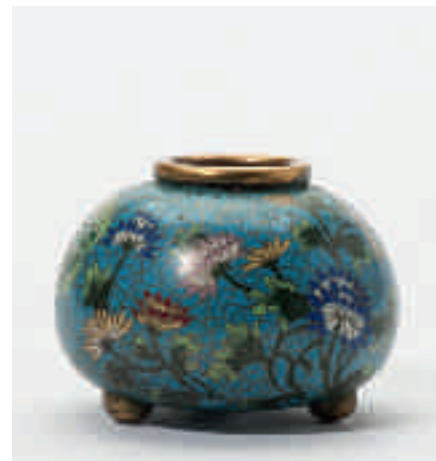
193 Een peervormige email cloisonné vaas