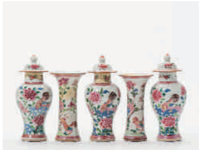
117 Een vijfdelig 'famille-rose' kaststelletje