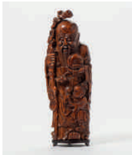
222 Een bamboe Shoulao