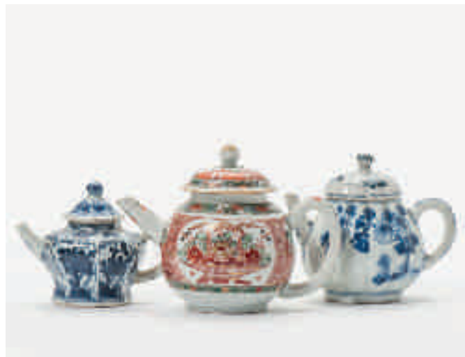
113 Een Amsterdams bont en 'famille-verte' theepot met deksel en twee blauw-witte theepotten met deksels Qianlong De eerste met hengselmand decor, de tweede peervormig en geribd, de derde kantig. H. 11,5 / 10,5 / 8 cm (3x) € 600 - 1.000