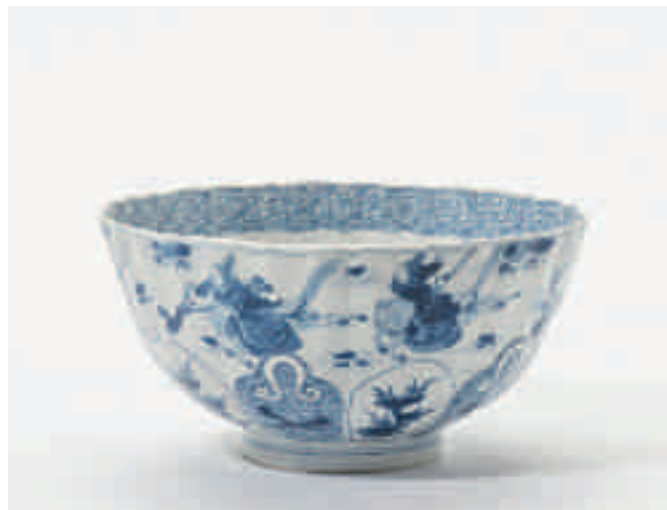
97 Een gebombeerde blauw-witte kom