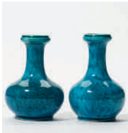
191 Een paar bolvormige turkoois geglazuurde vazen