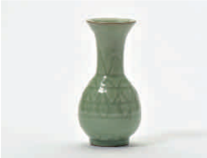
175 Een peervormige Longquan celadon vaas met trompetvormige hals