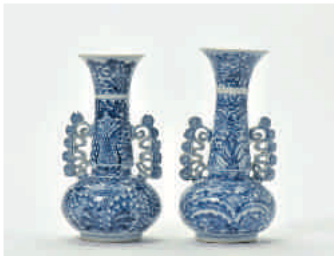
194 Een paar blauw-witte vazen