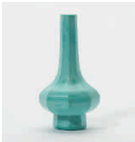
192 Een achtkantige turkoois kleurige Peking glazen vaas

Ingegrift vierkaraktermerk Daoguang en periode