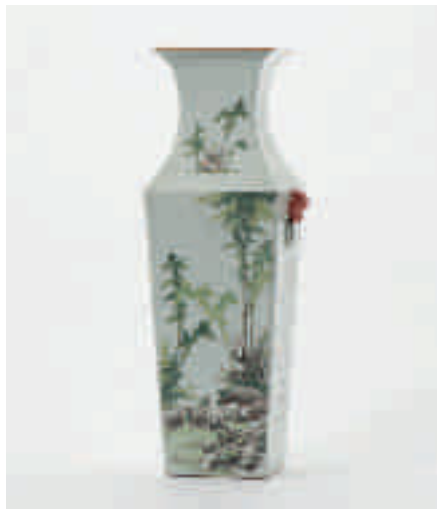
189 Een vierkante vaas met trompetvormige hals