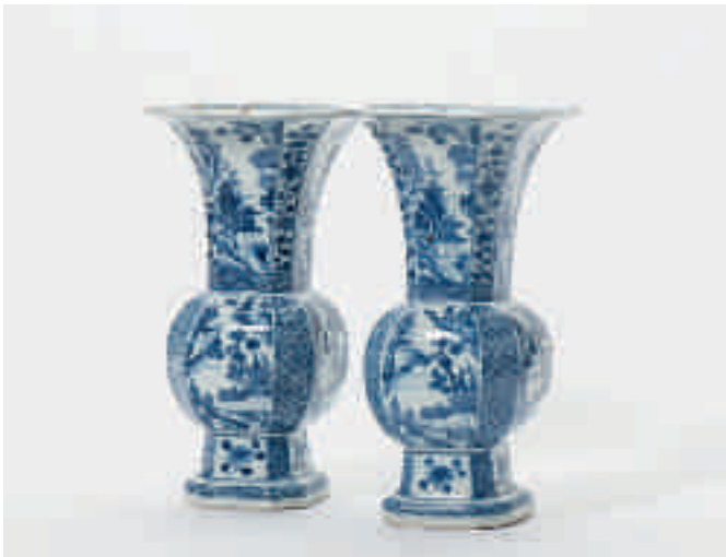
116 Een paar achtkantige blauw-witte vazen met trompetvormige hals

D. Howard & J. Ayers, China for the West , Sotheby Parke Bernet, London and New York 1978, Vol. II, pag. 564, no. 583 voor een compleet exemplaar en het Meissen prototype € 600 - 1.000