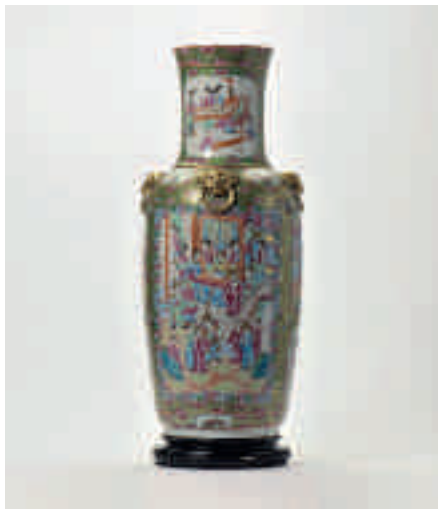
199 Een grote Kanton 'famille-rose' vaas