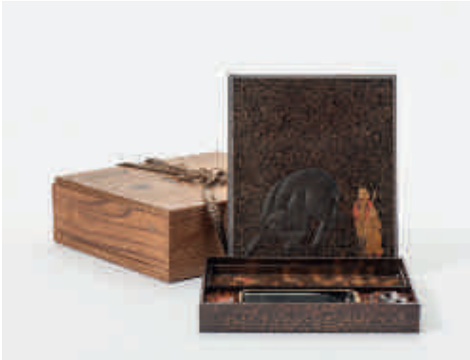
219 Een rechthoekige gelakte schrijfdoos (suzuribako)